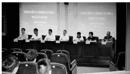
2019年8月，医学院举行2019级临床医学专业硕士研究生新生入学见面会