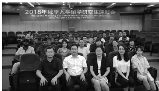
医学院 2018 年秋季入学留学研究生迎新会留影