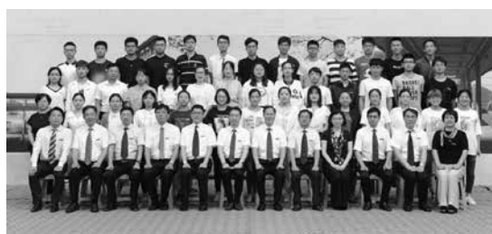
2019年9月，医学院2019级临床医学专业硕士研究生班入学留影